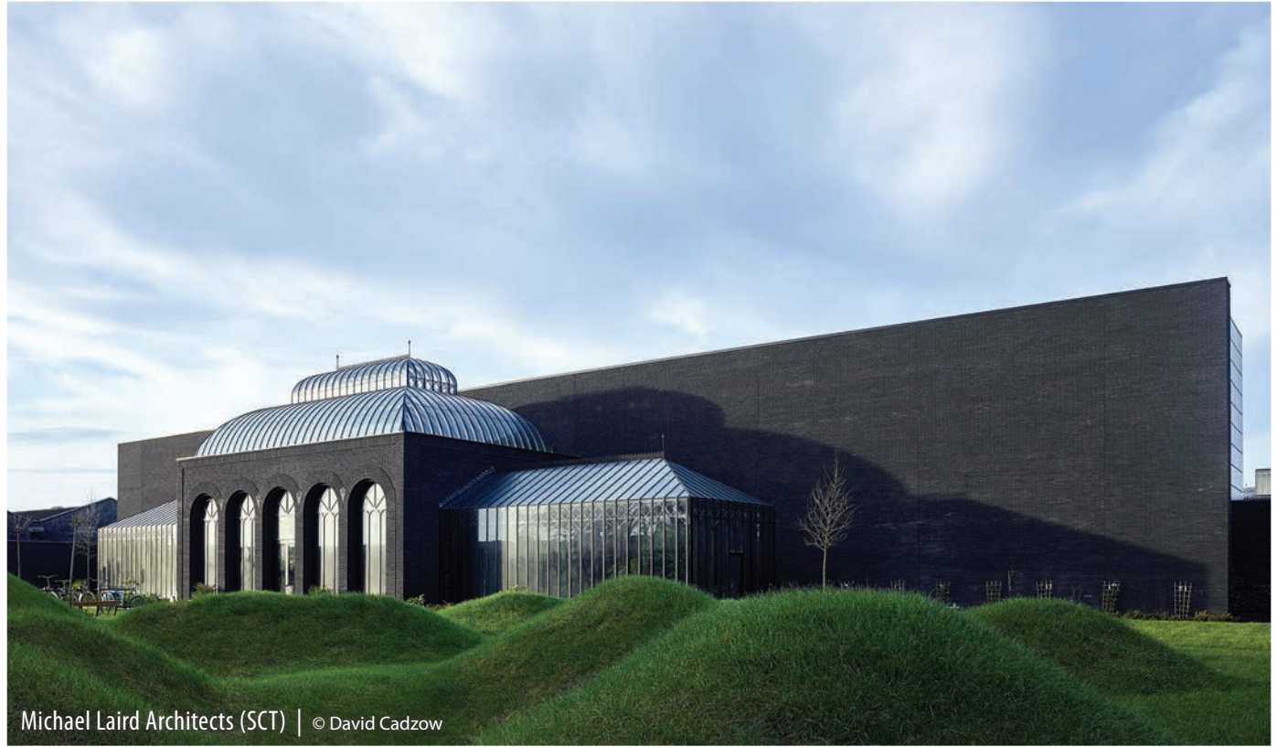
Michael Laird Architects (SCT) | © David Cadzow