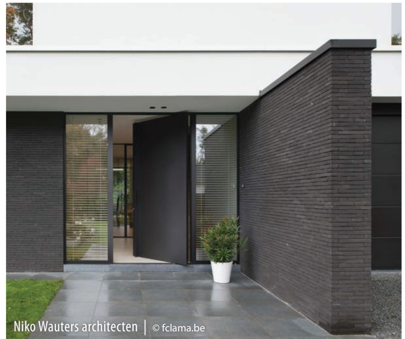
Niko Wauters architecten