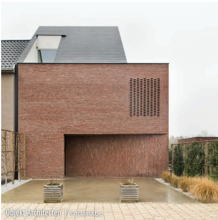
Objekt Architecten