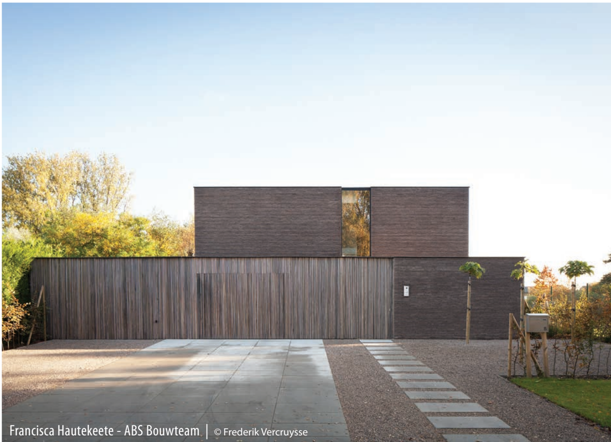
Francisca Hautekeete - ABS Bouwteam