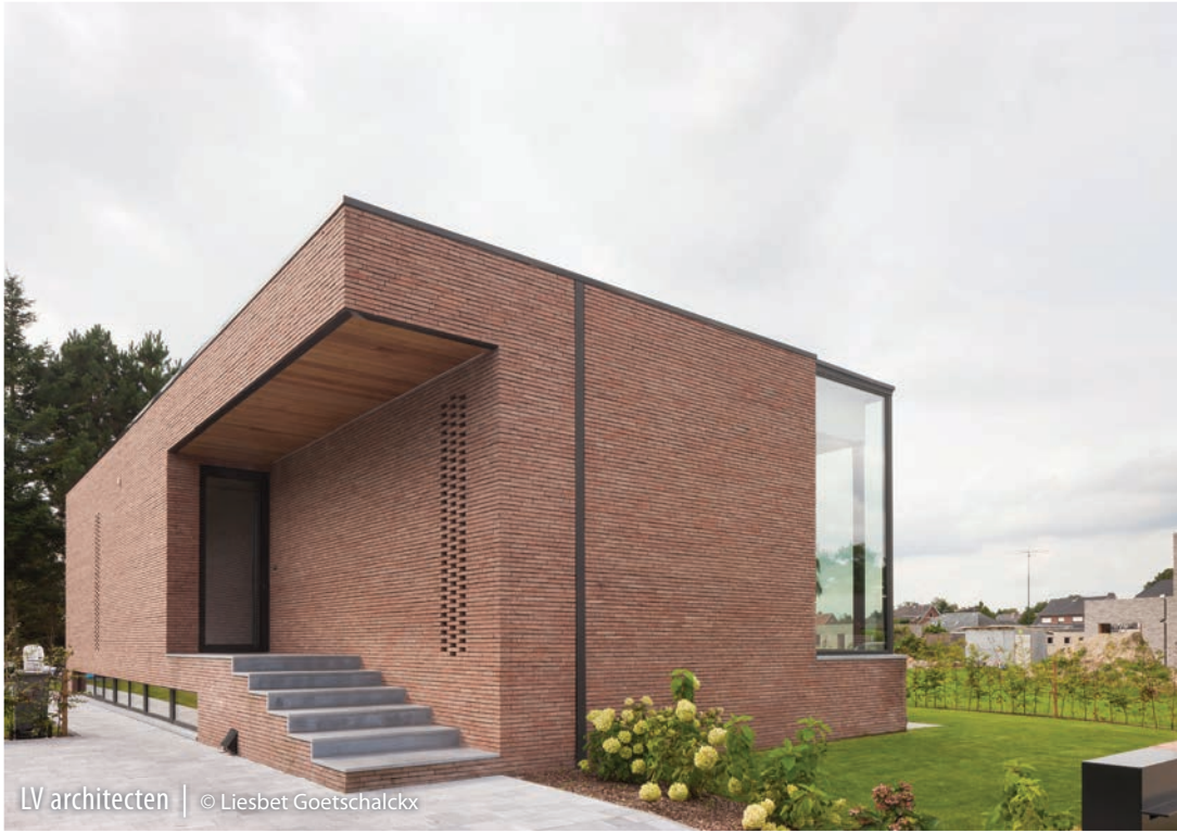
LV architecten | © Liesbet Goetschalckx