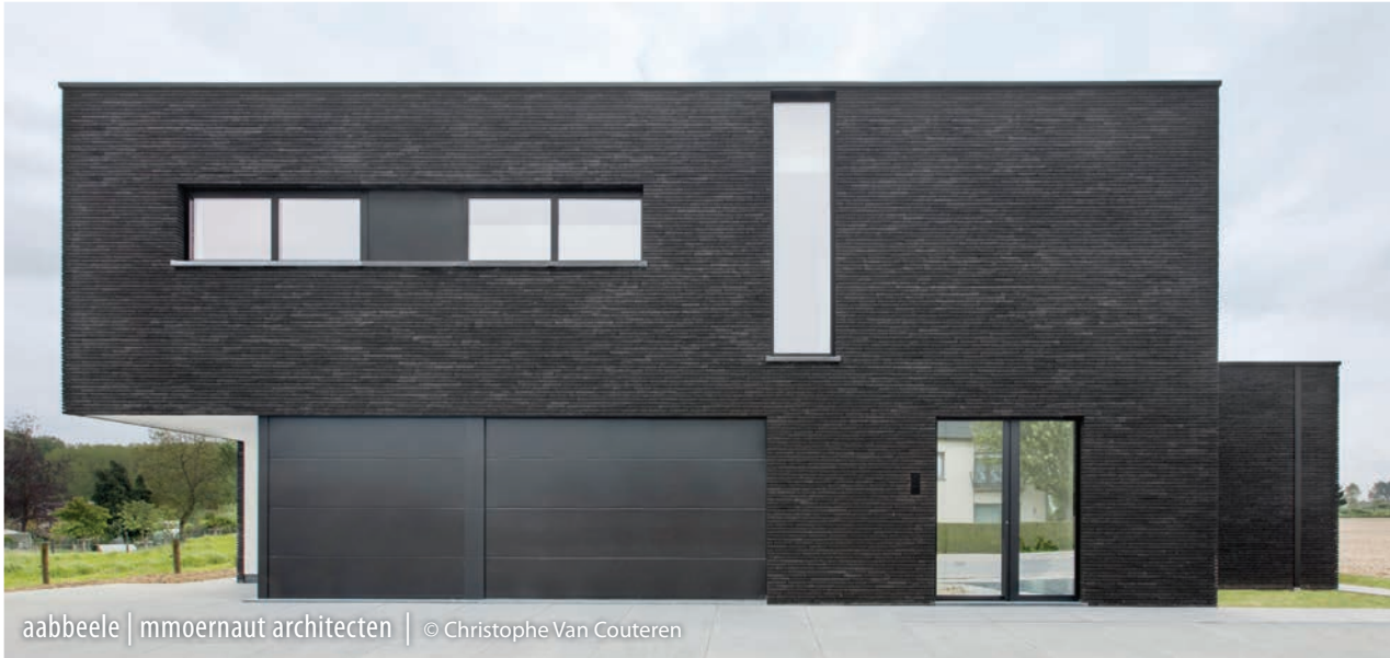
aabeele | mmoernaut architecten