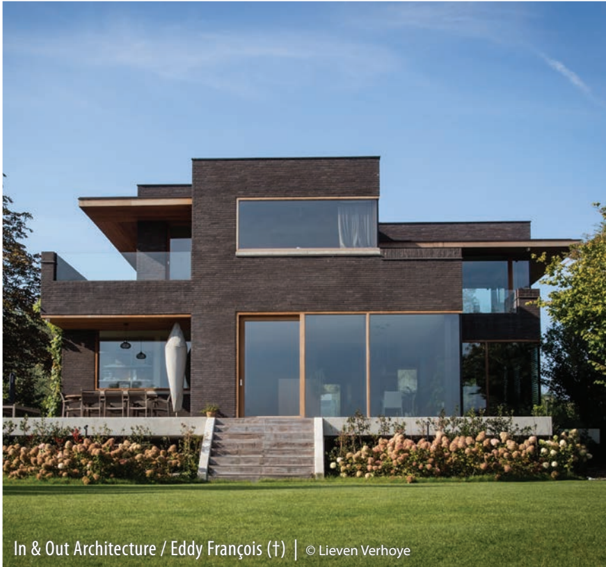
In & Out Architecture / Eddy François (†)