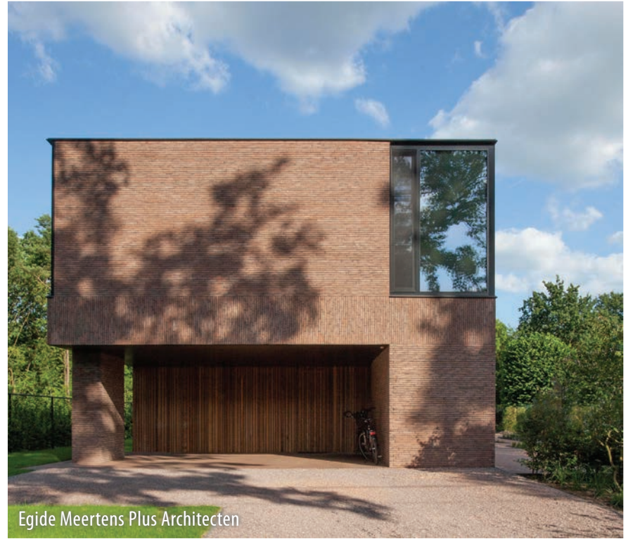
Egide Meertens Plus Architecten