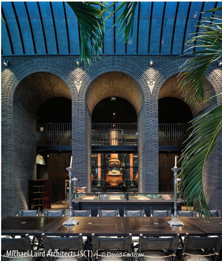
Michael Laird Architects (SCT)