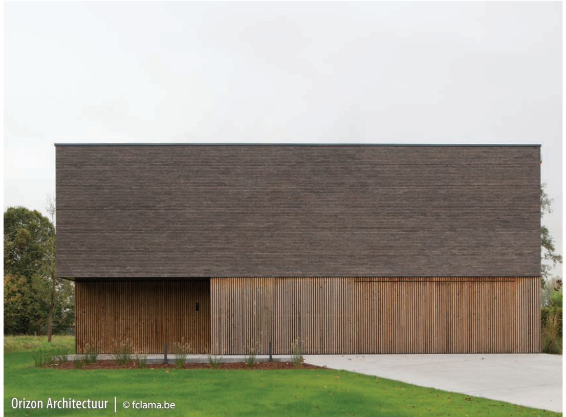
Orizon Architectuur