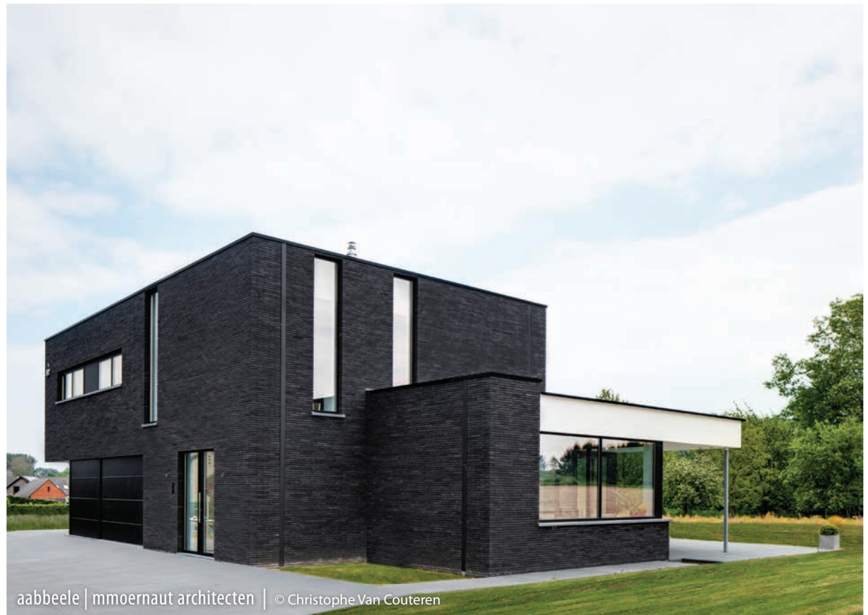
aabeele | mmoernaut architecten | © Christophe Van Couteren